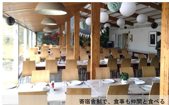
寄宿舎制で、食事も仲間と食べる

例えばデンマークでは「民主主義」が大事なキーワードになっていますが、世界には「民主主義」ではない国もあります。対話を通し、民主主義が本当にいいことなのかを考えるのです。キャリアアップの為の学校ではない。学びを通して自分の考えを深掘りするための学校が、フォルケホイスコーレなのです。