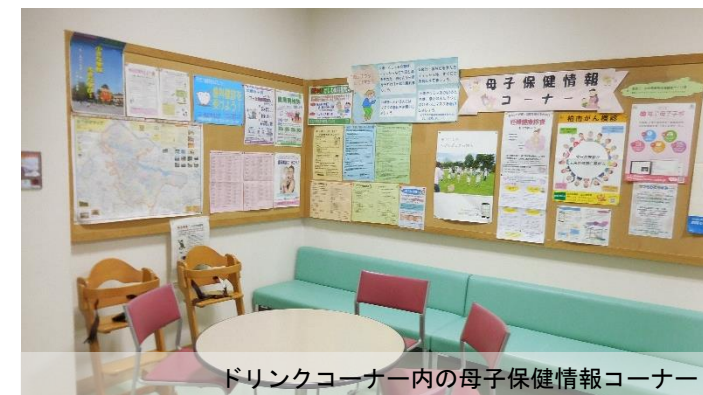
ドリンクコーナー内の母子保健情報コーナー

また、『学校図書配送コーナー』が併設されており、市内小中学校の学校図書館との連携拠点になっています。柏市では、小中学校全校に『学校図書指導員』を配置し、学力向上の基盤となる学校図書館を活用した授業実践にも力を入れているそうです。また、本に親しむための入り口として、『子ども司書養成講座』『市内中学・高校生知的書評合戦(ビブリオバトル)』を開催する等、乳幼児期からの一貫した読書推進活動が行われているとのことです。