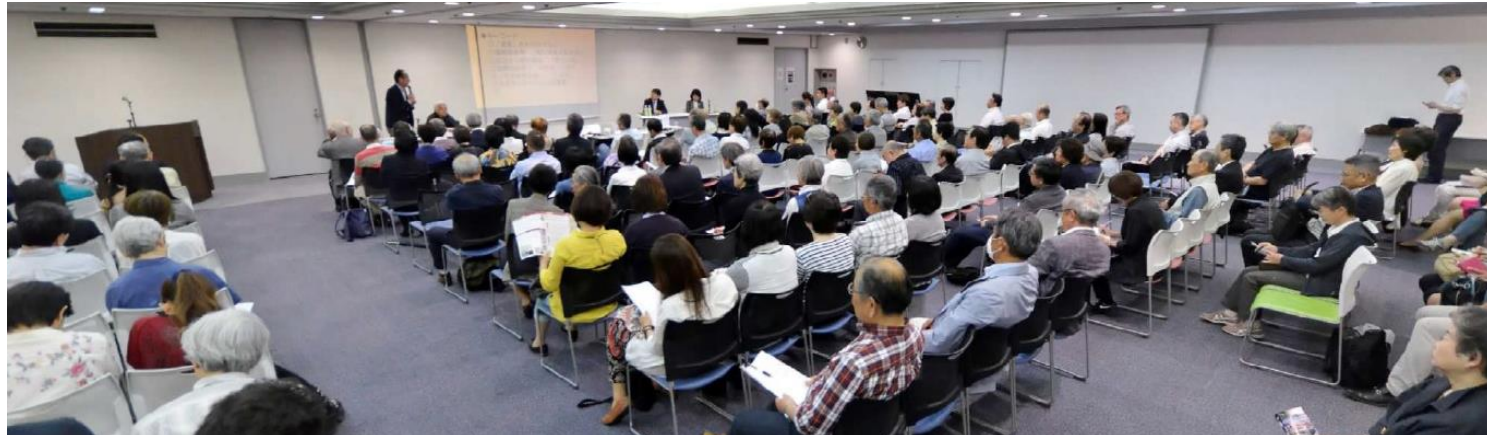
日本葬送文化学会30周年シンポジウム 終活ブームのつぎを本音で考える—「終活」後の不安を感じた事がありますか？ 会場の様子

日本葬送文化学会30周年シンポジウム「終活ブームのつぎを本音で考える—“終活”後の不安を感じた事がありますか？」と題したシンポジウムが5月7日に毎日ホール(千代田区一ツ橋1-1-1、毎日新聞東京本社地下1階)で行われました。こちらのシンポジウムに、生涯学習研究所が開催協力をさせていただきましたので、ご報告をさせていただきます。