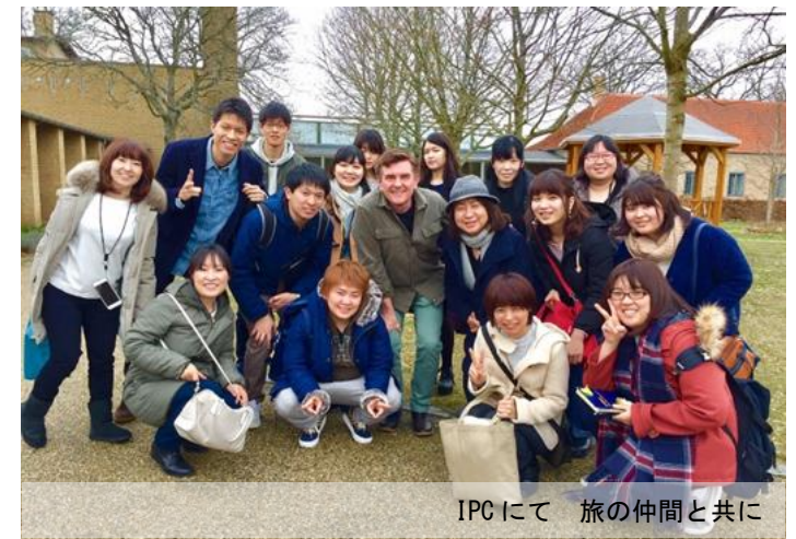
IPCにて 旅の仲間と共に

聖徳大学人文学部生涯教育文化学科 2013 年度卒業。学生時代より、青少年教育施設でのボランティア活動に励み、現在は民間企業で社会教育主事（地域コーディネーター）として、地元海老名市にあるフューチャーセンター（まちづくりセンター）にて学童保育の運営を行っている。立教大学大学院 21 世紀社会デザイン研究科博士前期課程で勉強中の社会人大学院生でもある。