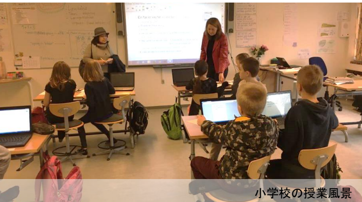
小学校の授業風景

デンマークで印象深かった点は2つ「グループワーク」と「民主主義」です。今回は小学校の話ですが、グループワークは小学校だけでなく盛んな訳ではありません。中学・高校や大学もグループワークが中心になっていました。インターネットで「デンマーク グループワーク」と検索すれば、たくさんの記事がでてきます。したがって、これは私の視察だけの話ではないと思います。