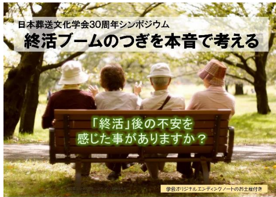
日本葬送文化学会30周年シンポジウム 終活ブームのつぎを本音で考える