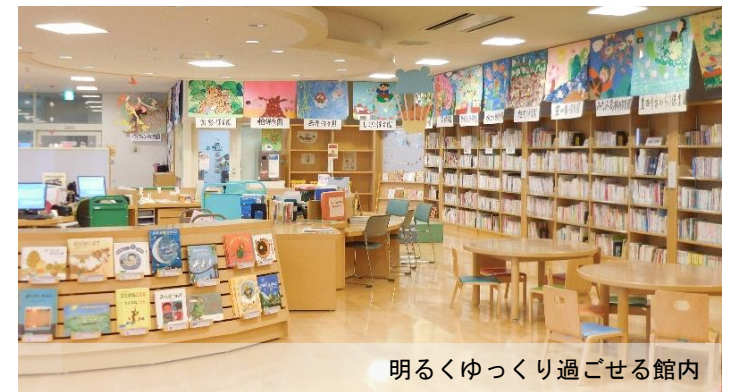
明るくゆっくり過ごせる館内

図書館内はとても明るく広々していて、床は靴を脱いで、寝ころがったりのびのびできるよう床暖房付フローリングになっています。週末は、父親と来館する子どもも多く、親子でゆっくりすることができます。また、赤ちゃんが寝てしまった時のためにベビーベッドを2台設置しています。