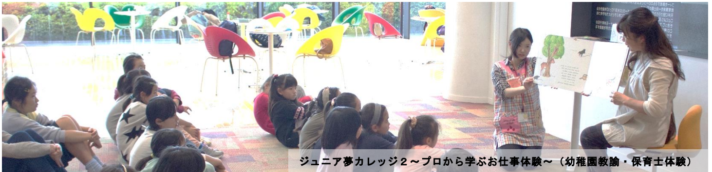
ジュニア夢カレッジ2～プロから学ぶお仕事体験～（幼稚園教諭・保育士体験）