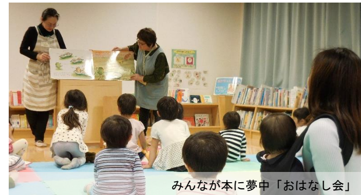
みんなが本に夢中「おはなし会」

こども図書館は、開館当初から乳幼児とその保護者を主な対象としており、乳幼児と本との出会いの場、親子の読書活動の普及の場となることを目的としています。したがって、親子を対象とした各種イベントを毎日開催し、図書館利用者の裾野を広げる活動を行っています。毎日開催している理由について、柏市立図書館の鴨志田さんは、「できるだけ多く子どもと保護者に、絵本に触れるきっかけや楽しみ方、子育てに関する情報等に接して頂きたいからです。特に、本に興味がない保護者や、興味があってもお子さんが本を乱暴に扱わないか心配されている保護者、そういう方にも来て頂きたいと思い、イベントを毎日開催しています」と語っていました。取材当日も、雨の中多くの家族連れがイベントに参加していました。この日は、8つのお話が披露され、どのお話も子ども達は夢中になっていました。