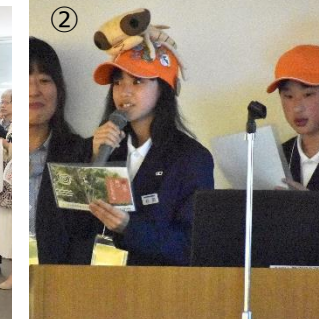
②こども環境活動賞受賞者によるスピーチ